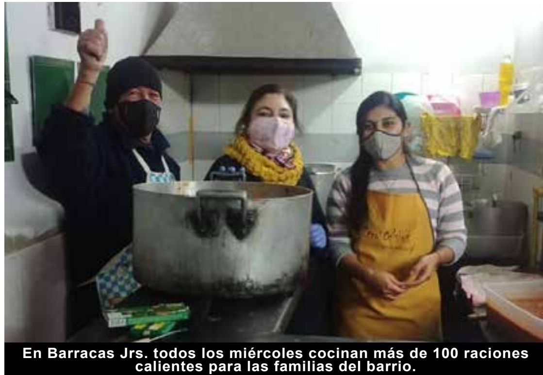
En Barracas Jrs. todos los miércoles cocinan más de 100 raciones calientes para las familias del barrio.

La falta de partidos, el corazón de cualquier actividad deportiva, hizo mella en el interés de los/