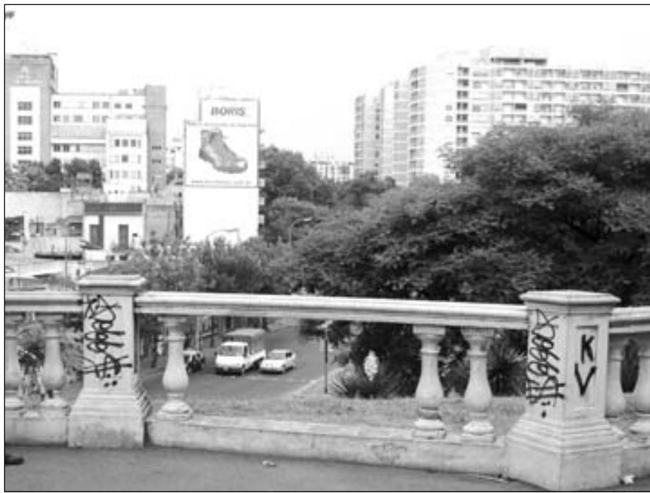
DESTRUIDO. Las escalinatas del anfiteatro, los balcones que dan al nacimiento de la avenida Brown, las callecitas internas que lo atraviesan. Todo en el parque es abandono.