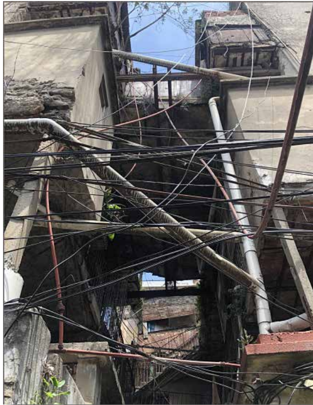
Gráfico 11 - VCP con hacinamiento

En cuanto al acceso a los servicios elementales, el relevamiento identificó que en el 28% de las viviendas no tienen red eléctrica con medidor individual mientras que la mitad cuenta con instalaciones eléctricas caseras, deficientes y, obviamente, inseguras. Este tipo de cableado puede generar cortocircuitos que, muchas veces, son la chispa que enciende el fuego de los históricos incendios. El mantenimiento de conexiones internas de agua y saneamiento sólo llega a poco más de la mitad de las viviendas. Y el 5% ni siquiera tiene acceso a la red de agua, en la Ciudad más rica del país. El acceso a la red de gas con medidor es bajísimo. Casi 7 de cada 10 viviendas no cuentan con ese servicio básico y deben usar garrafas o conectarse a dispositivos eléctricos para cocinar, bañarse con agua caliente o calefaccionarse. Dispositivos conectados a esas instalaciones precarias de las que hablamos en el párrafo anterior. En los 3500 hogares que habitan dentro de las viviendas colectivas el hacinamiento también es moneda corriente. En la mitad, se comparte el baño y en el 20%, la cocina. El dormitorio de cada hogar también es compartido entre tres o más personas en un 57% de las viviendas.