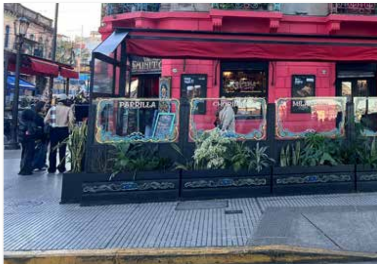
La vereda donde históricamente se ubicaba la feria artesanal no se liberó: hoy está ocupada por la extensión de los bares.