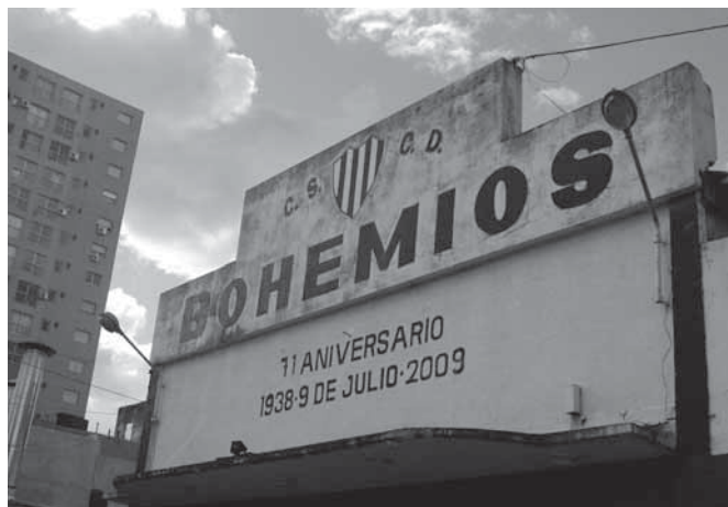
EN 1938. El club nació en Necochea al 800, a sólo una cuadra de la sede actual.

Aunque ese tiempo pasó y la vida cotidiana de los porteños cambió, existen todavía clubes que luchan por conservar ese espíritu de los barrios de aquella época no tan lejana. Uno de ellos es el Bohemios de La Boca. Ubicado en el corazón del barrio, el club nació como tantos otros de la capital, por el impulso de jóvenes que soñaban con fundar un lugar donde reunirse. Y así fue como el 9 de julio de 1938, en una pieza de la calle Necochea al 800, un grupo de muchachos lo hicieron realidad bajo el nombre de Club Social, Cultural y Deportivo Bohemios. Al poco tiempo pasaron al 972 de la misma calle hasta que gracias a la ayuda de los vecinos, luego de cuatro años de vida, el club llegó a su sede