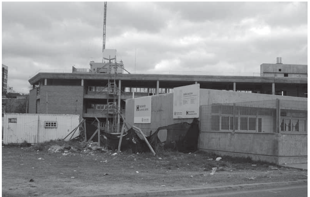
LENTO. El Polo Educativo de La Boca se anunció durante la gestión de Anibal Ibarra y las obras aun no han sido terminadas.

La cifra que promete Macri estaría entre los 320 y los 350 millones, según lo que se obtenga por el tercer y último terreno. De ese total, dicen desde el Ministerio de Educación, 30 millones se utilizarán para finalizar las obras del Polo Educativo de Saavedra, e incluso que "cuatro de las cinco escuelas" que albergará dicho polo "serán inauguradas durante esta gestión", incluyendo "la escuela de danzas y música más importante de la Ciudad".