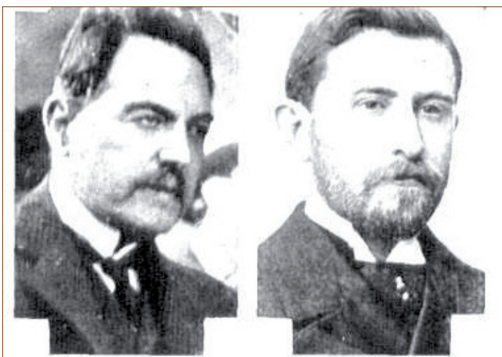
A raíz de la revolución de 1893, don Hipólito Yrigoyen se batió con el doctor Lisandro de la Torre y le produjo en la mejilla un tajo que el actual senador santafecino lleva bajo la barba.

Hace 118 años los radicales Hipólito Yrigoyen y Lisandro de la Torre se enfrentaron con sables en los galpones de Catalinas. El escenario: una interna en el partido en torno a una posible alianza con Bartolomé Mitre para derrotar a Julio Roca en las elecciones de 1898.