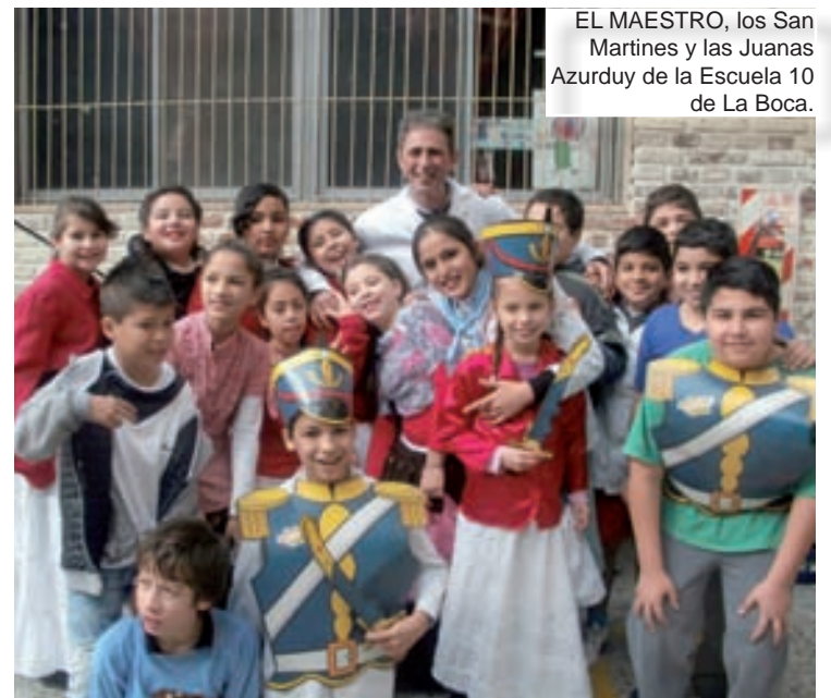
EL MAESTRO, los San Martines y las Juanas Azurduy de la Escuela 10 de La Boca.

Por Pablo Rodríguez, maestro de La Boca.